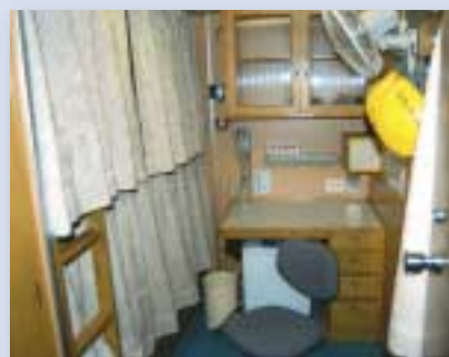
研究者の居室。左手に二段ベッドがある。