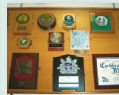
世界の様々な国の入港記念盾が飾られている。

減するプロペラやスラスターの開発、エンジンの振動を伝えにくくする防振構造の採用、観測時の電気推進など、海洋研究船として洋上における観測作業に支障ないように、様々な工夫が凝らされている。また、各種測位装置をはじめ、ジョイスティックコントロールシステムによりパウスラスタ（2基）、スタンスラスタ（1基）、推進プロペラ（2基）、舵（2基）を操作して、観測作業時の優れた操作性と保針性を確保するなど、建造当時における最新のシステムが導入されている。さらに、船内にはシービーム、CTD解析処理装置、生物資源音響探査装置、地層探査装置、船上重力計、音響測位システムなど、数多くの高性能研究設備が備えられている。航行データ、人工衛星データをはじめ、これらの観測機器によるデータは、光データリンクシステムおよび船内ネットワークシステムによって船内で処理され、各研究室・居室で、データを取り出すことができる。