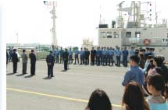
4月20日、「淡青丸」の入港歓迎式が行われた。(横須賀本部)

こうして誕生した学術研究船「白鳳丸」、「淡青丸」によって、これまで海洋科学に関する幅広い分野における基礎研究から応用研究まで、多様な観測・研究航海が行われてきた。「白鳳丸」は太平洋からインド洋といった全地球海洋を対象に、「淡青丸」は日本の沿岸および外洋でと、それぞれの特徴を生かしながら