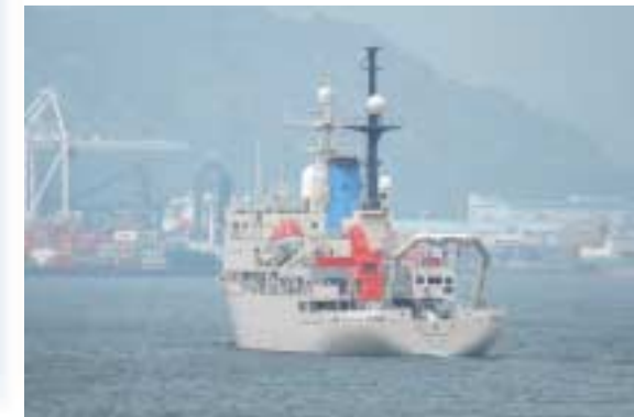
5月13日、清水港より中西部太平洋海域へ航海に出る「白鳳丸」。