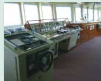
「白鳳丸」の操舵室の様子。

学術研究船「白鳳丸」は総トン数3,987トン、全長100mの大型研究船だ。近海・遠洋を問わず、極海を含めた世界の海を舞台として、長期間の多目的研究航海に活用されている。気泡障害の少ない船型、水中放射雑音を低