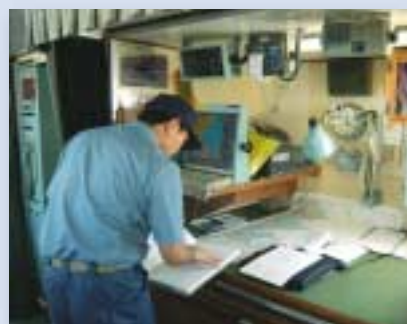
「淡青丸」の操舵室（チャートテーブル付近）の様子。