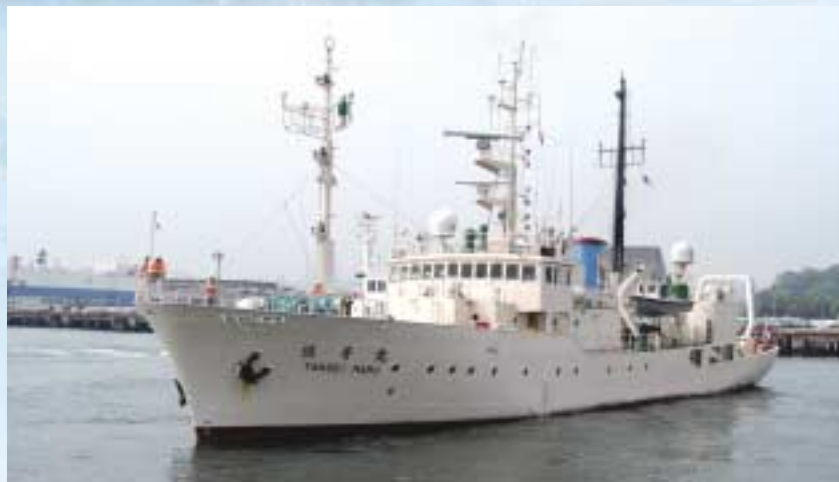
学術研究船「淡青丸」