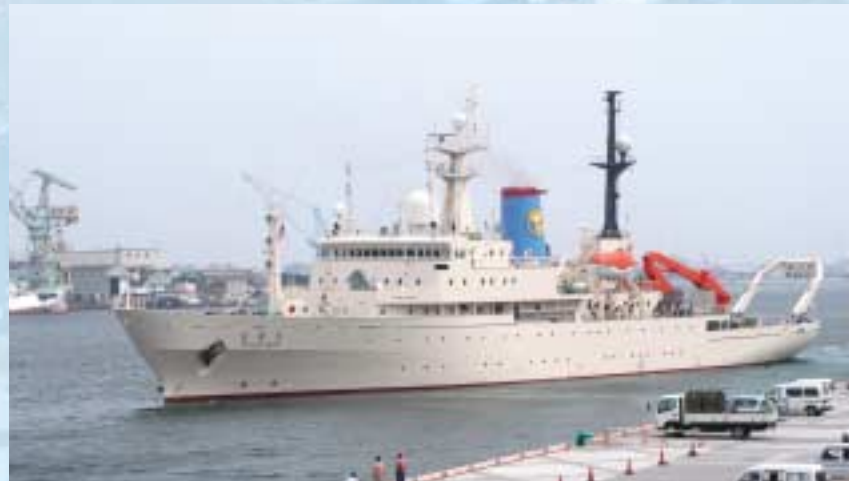
学術研究船「白鳳丸」