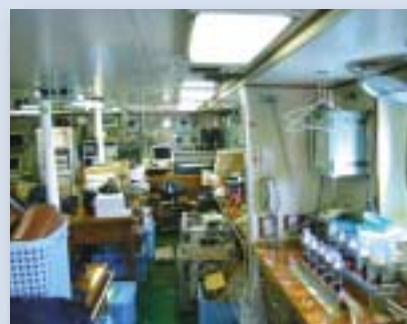
船体中央部にある研究室スペース。