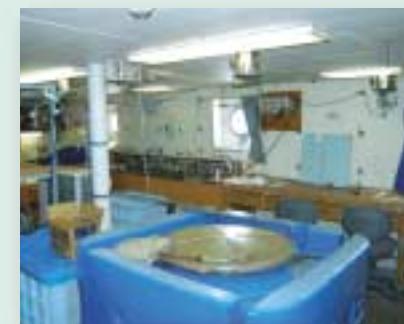
搬入された研究機材で一杯の第7研究室。