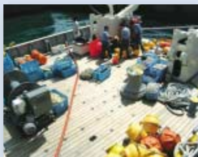
観測作業甲板。左舷側にウインチ類を配置。